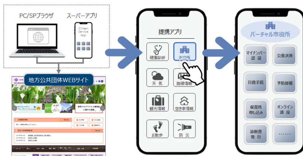
(スーパーアプリ構想イメージ図)

JAPANDXとエルテスは、今回の紫波町との公民連携プロジェクトを経て、全国1,700の地方公共団体を対象に住民総合ポータルアプリを搭載したスーパーアプリの提供を目指し、地域課題の解決に寄与します。